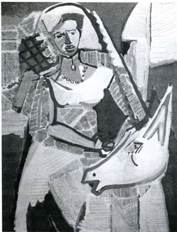
La Dame à la Licorne