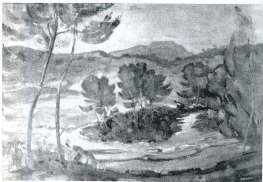
Paysage du Languedoc